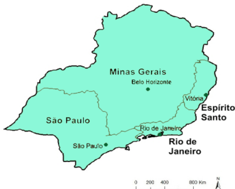
Figura 1- Mapa da Região Sudeste

A Região Sudeste do Brasil, conforme dados do Instituto Brasileiro de Geografia e Estatística (IBGE), com extensão territorial de 924.511, 3 quilômetros quadrados, é a segunda menor região do Brasil, sendo maior apenas que a região Sul. Os estados que compõem o Sudeste são: Espírito Santo, Minas Gerais, Rio de Janeiro e São Paulo, como mostra a figura abaixo: